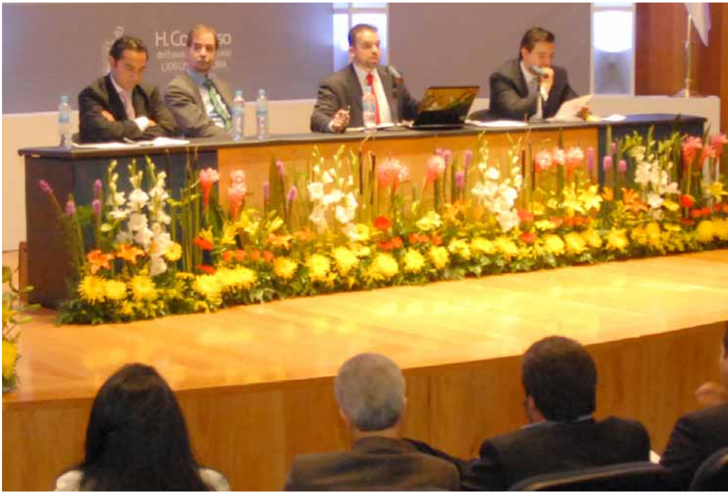
>El Foro contó con la participación de alumnos, catedráticos, políticos y diputados.